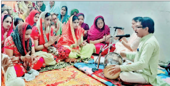
उचाना। कीर्तन में पहुंचे श्रद्धालु।

लोगों की जांच के लिए रक्त के नमूने भी लिए। स्वास्थ्य कर्मियों ने घर-घर जाकर लोगों को बताया कि प्रत्येक व्यक्ति यदि थोड़ी सी सावधानी करके अपने घर तथा आसपास की सफाई करते हुए गांधी, खाली पड़े, टायरों व गमलों आदि में गंदा पानी खड़ा न होने दे, पानी के बर्तनों को ढक कर रखें।