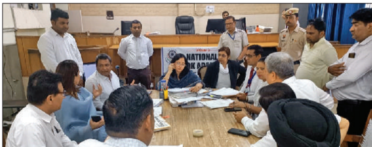
कैथल। राष्ट्रीय लोक अदालत में मामलों का निपटारा करते न्यायाधीश।