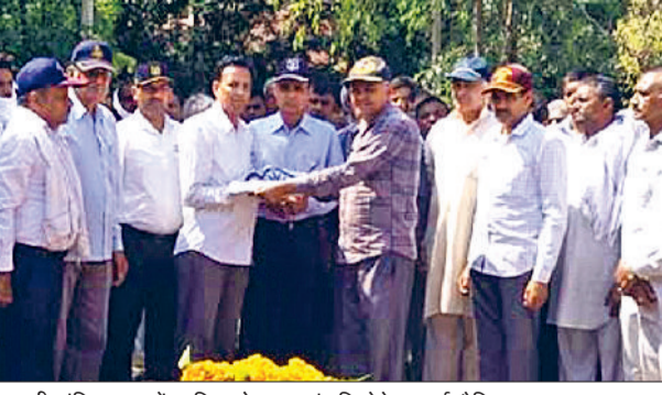
पुंडरी। पूरव सैनिक की अंतिम यात्रा में शामिल होकर श्रद्धांजलि देते हुए पूरव सैनिक।