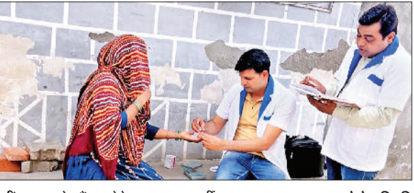
रक्त के सैपल लेते हुए स्वास्थ्यकर्मी।