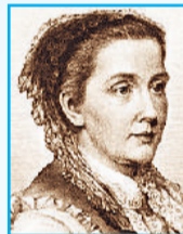
जूलिया वार्ड होवे

स्वरूप के मद्रस-डे की संस्थापक ब्रिटिश सामाजिक कार्यकर्ता एना जार्विस मानी जाती हैं। सन 1870 में जूलिया वार्ड होवे ने महिलाओं से अपने मां के सम्मान में मद्रस-डे मनाए जाने का आह्वान किया था। अगर कहे कि दुनिया में सबसे पहली बार इस दिवस की कल्पना उन्होंने ही की थी, तो गलत नहीं होगा, क्योंकि इस नारीवादी लेखिका ने देखा था कि खुद की कूरता को सबसे अधिक मांओं को झेलना पड़ता है। इसलिए युद्ध रोकने के लिए जूलिया वार्ड ने दुनियाभर की मांओं के लिए एकजुट होकर आगे आने का आह्वान किया था और दो वर्षों के बाद 1872 में पहली बार उनके नेतृत्व में इकट्ठी हुई महिलाओं ने 'मद्रस पीस-डे' मनाया, जो कि वास्तव में आज के मद्रस-डे की बुनियाद था। अमेरिका के कई शहरों में यह मद्रस पीस-डे अगले 30 सालों तक मनाया जाता रहा। लेकिन आगे चलकर एना जार्विस ने इस मद्रस पीस-डे को सिर्फ मद्रस-डे में बदल दिया। उन्होंने ऐसा इसलिए किया क्योंकि इससे हर कोई अपनी मां से जुड़ रहा था और मांओं के प्रति सम्मान का यह आदर्श दिवस बन गया था। -संस्थापिका