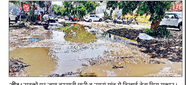
जींद। सड़कों पर जमा बरसाती पानी व नगूरों गांव में दिखाई देता गिरा मकान।