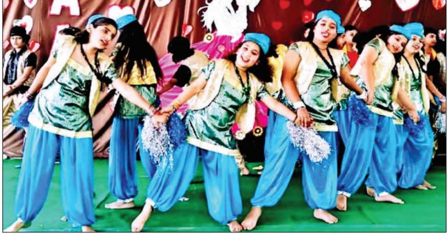
जीटी। सांस्कृतिक कार्यक्रम प्रस्तुत करते हुए बच्चे।