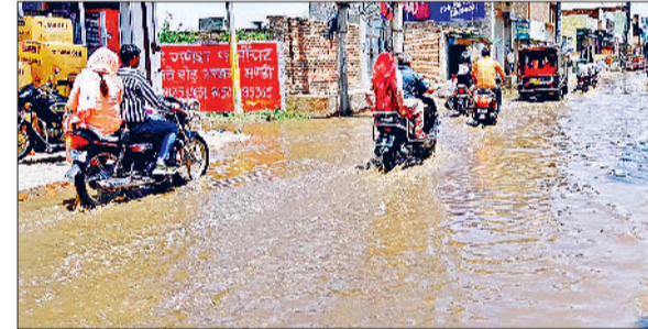
जींद। उचाना के रेलवे रोड पर भरा बारिश का पानी।

राजौद। कई दिनों से बरस रही आग ने जहां लोगों का जीना दुभर करके रख दिया है, वहीं शुक्रवार शाम को आवाजक हुई बूढ़ाबांड़ी से लोगों ने कुछ राहत की सांस ली। पिछले कई दिनों से पड़ रही जी तोड़ गर्मी से लोगों को राहत महसूस हुई। ग्रामीणों ने बताया कि झूलना देने वाली गर्मी से उन्हें थोड़ी राहत अवश्य महसूस हुई है। उल्लेखनीय है कि पिछले कई दिनों से गर्म हवाओं ने लोगों को घरों में दूबकने के लिए विवश कर रखा था। असहनीय गर्मी के कारण पशु भी बुरी तरह बेहाल हो रहे थे। आवाजक आसमान पर छाप काले बादलों के हुई बूढ़ाबांड़ी व ठंडी हवा से लोगों को बहुत राहत मिली है। इसके अलावा गांव नीमवाला व संतोख माजरा के रास्ते पर रात आए तेज तूफान से पेड़ गिरने से रास्ते अवरुद्ध हो गए। इसके अलावा कई मार्गों पर जो सूखे हुए पेड़ है वह भी टूट कर सड़क पर गिरे हैं। जिससे रात को ही रास्ते पूरी तरह से बंद हो गए।