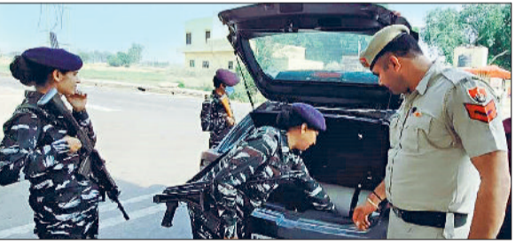
कैथल। वाहनों की जांच करती पैरामिलिट्री फोर्स की जांच।