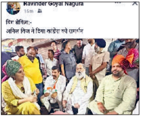
जीद। डाली गई पोस्ट।