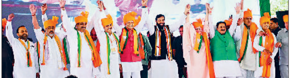
मुख्यमंत्री नायब सिंह सैनी रैली में हाथ उठाकर लोगों का अभिवादन स्वीकारते।

चुनाव जैसे-जैसे नजदीक आ रहा है, भारतीय जनता पार्टी की हुंकार बढ़ती जा रही है। कुरुक्षेत्र संसदीय क्षेत्र से पार्टी प्रत्याशी नवीन जिन्दल के समर्थन में आज कैथल-कलायत बीजेपी की विजय संकल्प रैली में कुछ ऐसा ही देखने को मिला। मुख्यमंत्री नायब सिंह सैनी ने भारी संख्या में जुटे लोगों का आह्वान किया कि वे नवीन जिन्दल