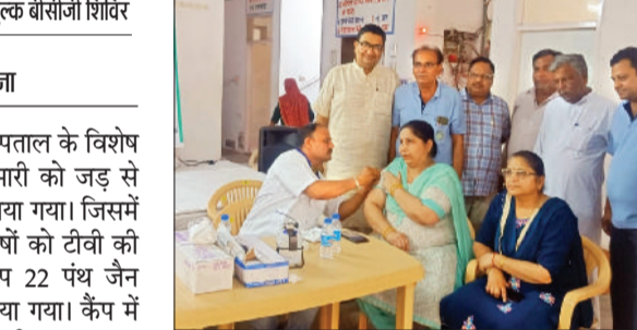
नरवाना। बीसीजी कैंप में वैक्सीन लगाती हुई महिला।